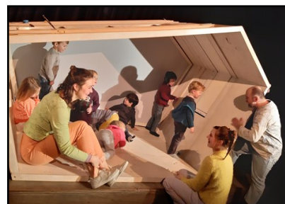
De jongste kleuters tijdens de voorstelling Boks

Zowel onze allerjongste als onze oudste leerlingen brachten deze week een bezoek aan het theater. Onze jongste kleuters trokken naar het Arenatheater en beleefden boeiende momenten met de voorstelling Boks.