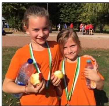
Céleste en Marie